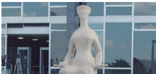
Supremo Tribunal Federal (STF)

STF veta greve de servidores de todas as carreiras policiais