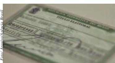
Título eleitoral pode ser cancelado em caso de irregularidades

Para regularizar a situação eleitoral, é necessário agendar data e horário no site do TRE-SP, na seção serviços ao eleitor, e comparecer ao cartório portando documento oficial e se possível, os comprovantes de votação, de justificativa e de quitação de multa. Segundo o tribunal, dois turnos de uma mesma eleição são considerados duas eleições para efeito de cancelamento. (Agência Brasil)