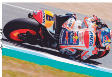
Dani Pedrosa (26) não deu chances aos adversários

Festa totalmente espanhola no Grande Premio da Espanha de Motovelocidade. Em todas as categorias o vencedor foi um hispânico. A Ducati fez festa para Lorenzo que obteve o 3º posto, no dia de seu aniversário. Foi o primeiro pódio do piloto na sua 4ª prova pela nova equipe. Dani Pedrosa, o vencedor, se coloca como um sério candidato ao título. O piloto, apesar de ser piloto da Honda oficial e estar há 11 anos na categoria nunca conquistou um na categoria principal. Página 6