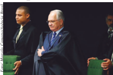
O ministro Luiz Edson Fachin, relator da Lava Jato no Supremo Tribunal Federal

Investigações Como os inquéritos são de responsabilidade do STF, caberá agora ao Ministério Público