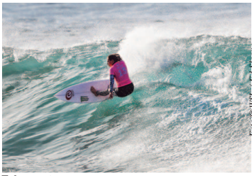
Tyler Wright (AUS)

A quarta-feira amanheceu com ondas de 3-4 pés em Bells Beach e o início da categoria masculina foi adiado, mas as meninas competiram em boas condições, pois o mar foi melhorando no decorrer do dia para elas darem um show na Austrália. As campeãs mundiais Tyler Wright e Carissa Moore se destacaram com grandes apresentações e a brasileira Silvana Lima finalmente venceu sua primeira bateria do ano no World Surf League Championship Tour. Ela vai disputar a última vaga para as quartas de final com a hexacampeã mundial Stephanie Gilmore, que defende a lycra amarela do Jeep WSL Leader no Rip Curl Women's Pro.