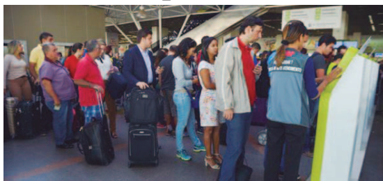
Fila de passageiros em Aeroporto

Justiça Federal suspende cobrança por bagagem despachada