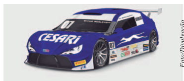
Campeonato Brasileiro de Turismo

A temporada 2017 do Campeonato Brasileiro de Turismo tem uma nova equipe, aliás, não tão nova, uma vez que já fez parte do grid da extinta "Stock Light", sendo a última equipe campeã da categoria de acesso à Stock Car em 2009. A Full Time Academy entra no Brasileiro de Turismo