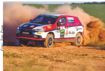
Mitsubishi Cup tem velocidade e adrenalina

Mitsubishi Motors realiza experiências off-road pelo Brasil