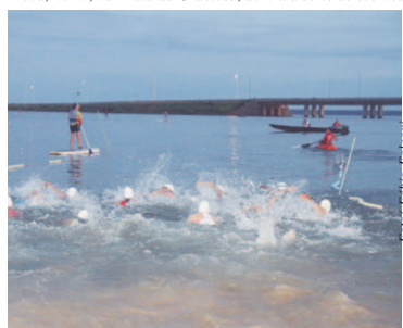
IRONMAN 70.3 Palmas 2017

Prova, no 23, na Praia da Graciosa, abrirá a série de eventos no Circuito IRONMAN no país