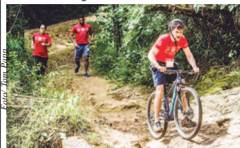
Muita aventura nas mais diferentes provas

São 29 datas por diversas cidades do Brasil. Um deles tem a sua cara. Há 26 anos no País e com a experiência de mais de 23 anos organizando e promovendo eventos off-road, a Mitsubishi Motors tem um cardápio completo quando o assunto é experiência 4x4.