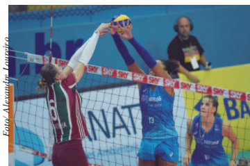
Fluminense x Vôlei Nestlé

Vôlei Nestlé e Rexona-Sesc vencem e garantem vaga nas semifinais