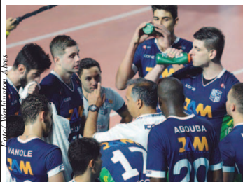
Minas jogará em casa

Lebes/Gedore/Canoas x Sada Cruzeiro e Minas x Sesi-SP fazem importantes duelos, ambos com transmissão do SporTV