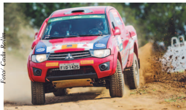
Novidade irá deixar disputas ainda mais emocionantes

Para abrir sua 18ª temporada, a Mitsubishi Cup preparou uma prova inovadora para as duplas: o rallycross. Inédita no Brasil, a competição, que mescla terra e asfalto com muita velocidade e "pegas" emocionantes, acontecerá no sábado, dia 1º de abril, no Autódromo Velo Città, em Mogi Guaçu (SP). Será a estreia de carros e duplas nacionais nessa modalidade, amplamente difundida nos Estados Unidos. Página 6