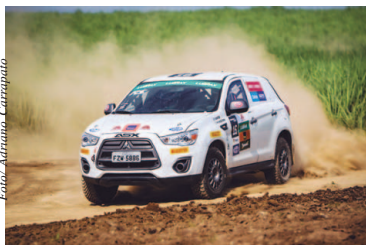
ASX RS vai encarar o rallycross

Depois de 1h20 de jogo, Nati foi eleita e melhor da partida, por votação popular realizada no site da CBV, e Bia foi a maior pontuadora do duelo, com 14 acertos. Após a partida, feliz com o resultado, Nati fez questão de elo-