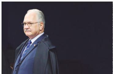
O ministro Luiz Edson Fachin participa de sessão da segunda turma do Supremo Tribunal Federal

Fachin recebe pedidos de investigação baseados nas delações da Odebrecht