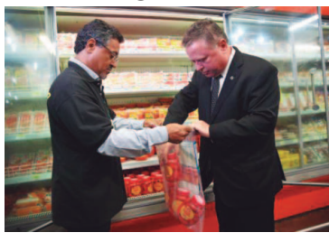
O ministro Blairo Maggi acompanha fiscalização em um supermercado de Brasília

Fiscais do Ministério da Agricultura, Pecuária e Abastecimento (Mapa) recolheram na quarta-feira (21), em um supermercado de Brasília, amostras de produtos de um dos três frigorí-