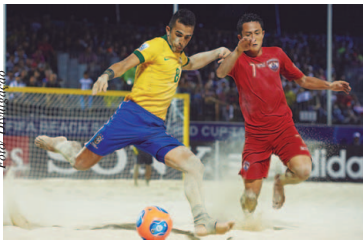
Seleção Brasileira vem embalada por uma sequência invicta de 29 partidas

"Temos três decisões nessa primeira fase. É esse o nosso pensamento. Em Copa do Mundo precisamos encarar cada jogo como uma final. O Taiti é uma das