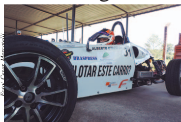
Alberto Cesar Otazú no Fórmula Vee

Depois de ter adquirido alguma experiência na pilotagem do Fórmula Vee em Piracicaba (SP), onde subiu no pódio com um